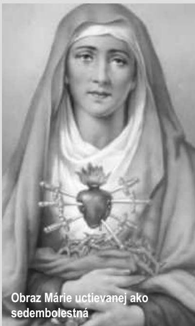
Obraz Márie uctievanej ako sedembolestná

pritiašlo by to do kresťanstva nových ľudí z pohanov. Samozrejme, najvhodnejším kandidátom sa jednoznačne stala Mária.