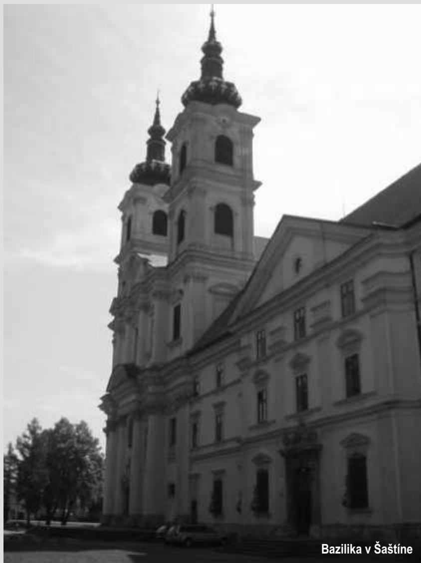
Bazilika v Šaštíne